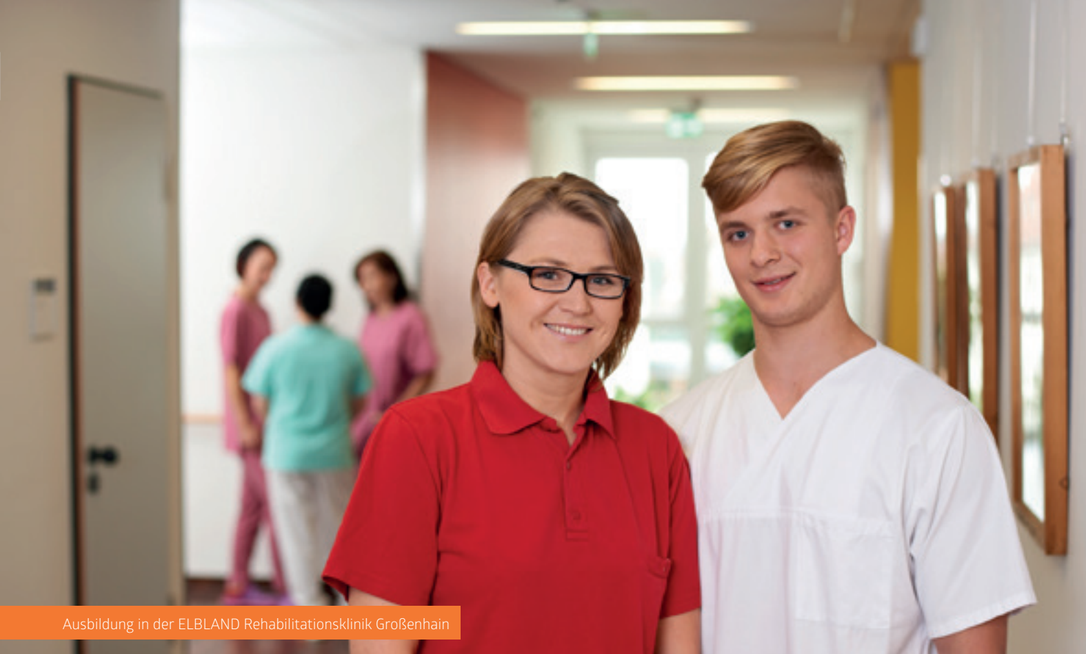
Ausbildung in der ELBLAND Rehabilitationsklinik Großenhain